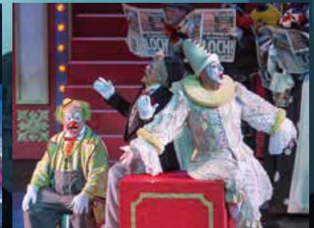
2017 »Circus Colonia«

»Umjubelte Aufführungen« oder »Ausverkauft – nur noch Restkarten erhältlich«, titeln Kölner Medien in den letzten Jahren häufiger über die Bühnenspielgemeinschaft »Cäcilia Wolkenburg«. Die »bunte Tochter« des Kölner Männer-Ge-